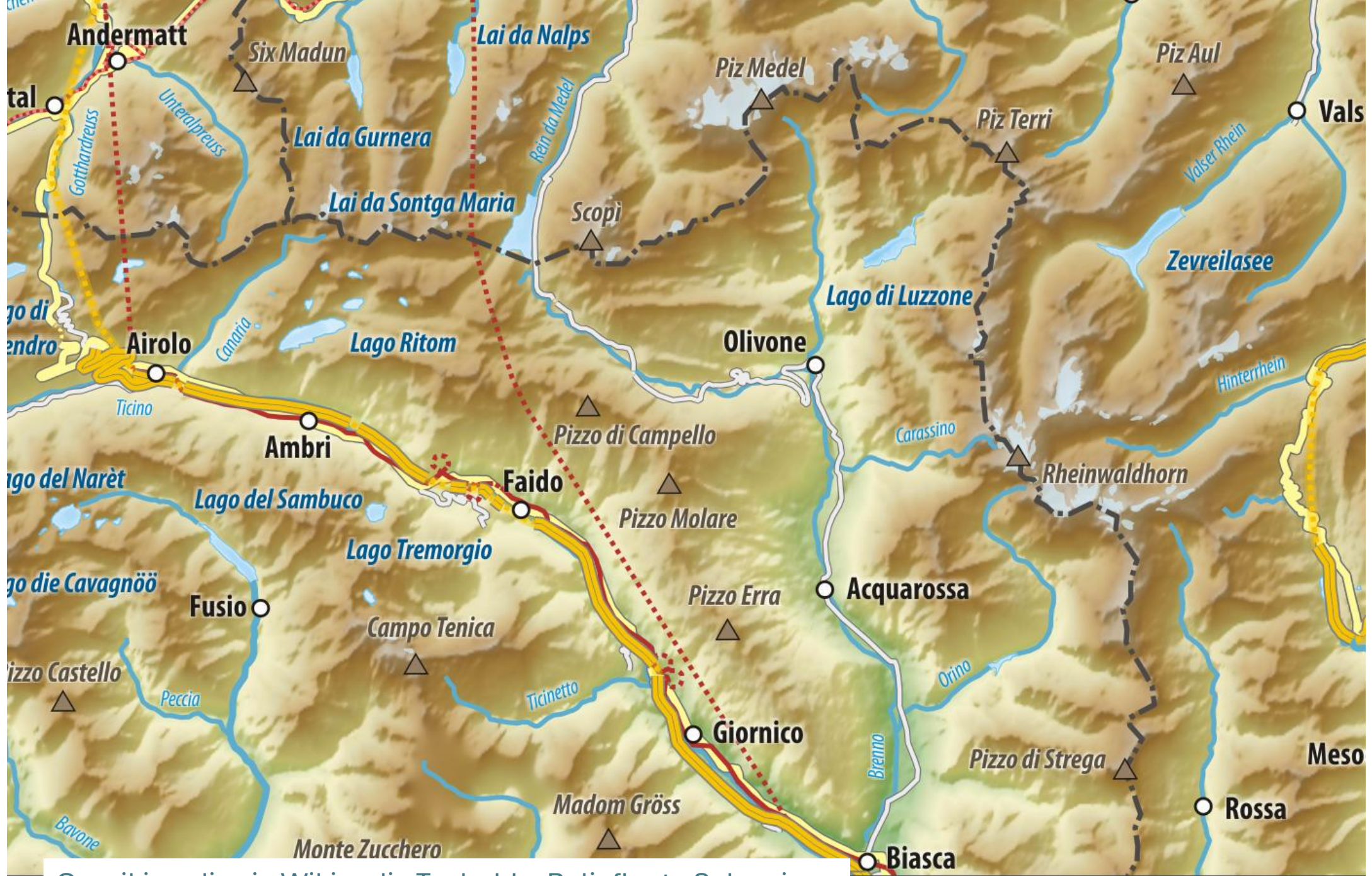
Cc wikimedia via Wikipedia Tschubby Reliefkarte Schweiz